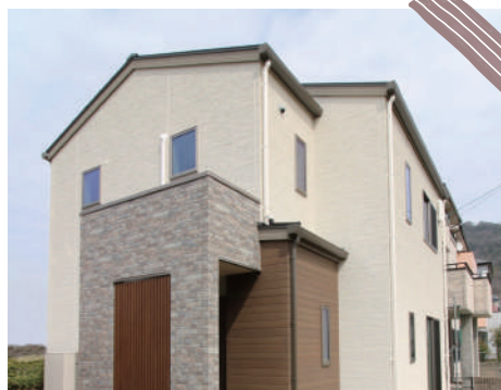
石目調・木目調の外壁と格子がアクセント。

2階に吹き抜けとロフトのあるセカンドリビングを設けることでより広がりを感じる空間に。さらにナチュラルモダンテイストに杉の一枚板や桧材、格子など、和の要素も取り入れることでより居心地の良い空間に仕上げました。